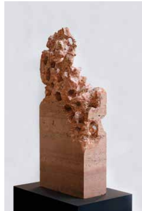
BIRGIT CAUER Brutkasten V , 2021