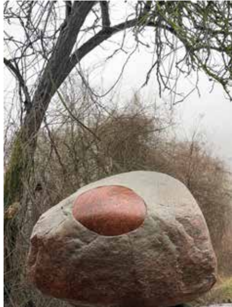
KUBACH & KROPP Augenstein , 2022