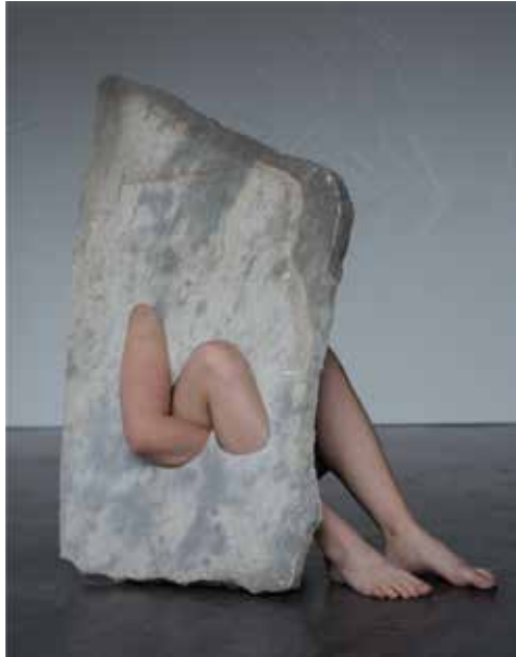
MILENA NAEF Fleeting Parts , 2020